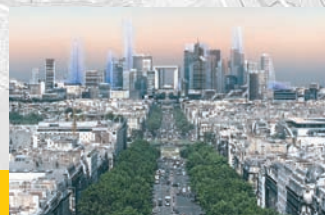
• La Défense