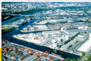
• Port de Gennevilliers